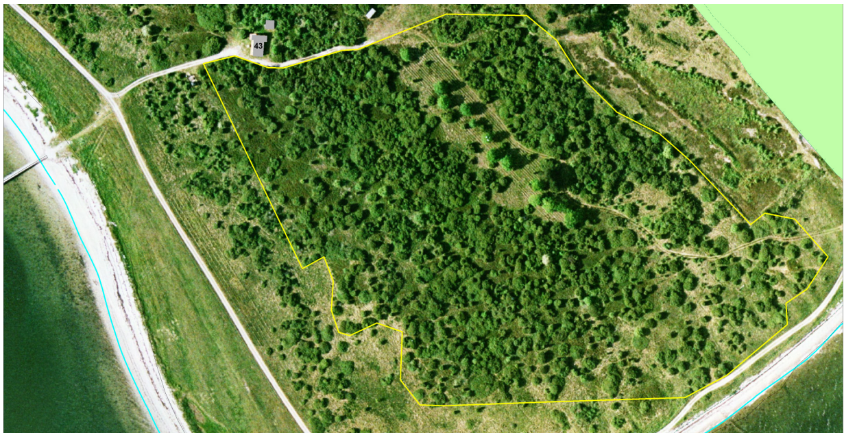
Luftfoto copyright COWI