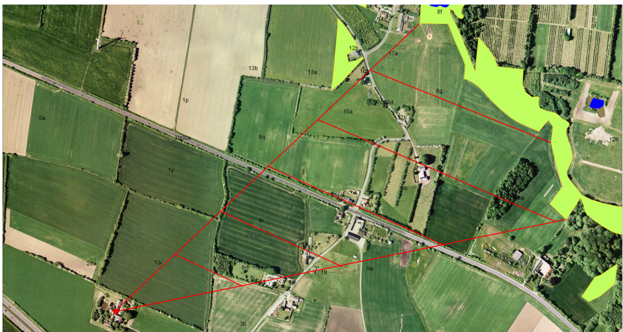
Luftfoto copyright COWI

Landbrug (l) er åbent land – dyrkede marker og/eller græsarealer – med læhegn, enkelte områder med træer, partier med krat, spredte bygninger mv. Opland er markeret med skravering.