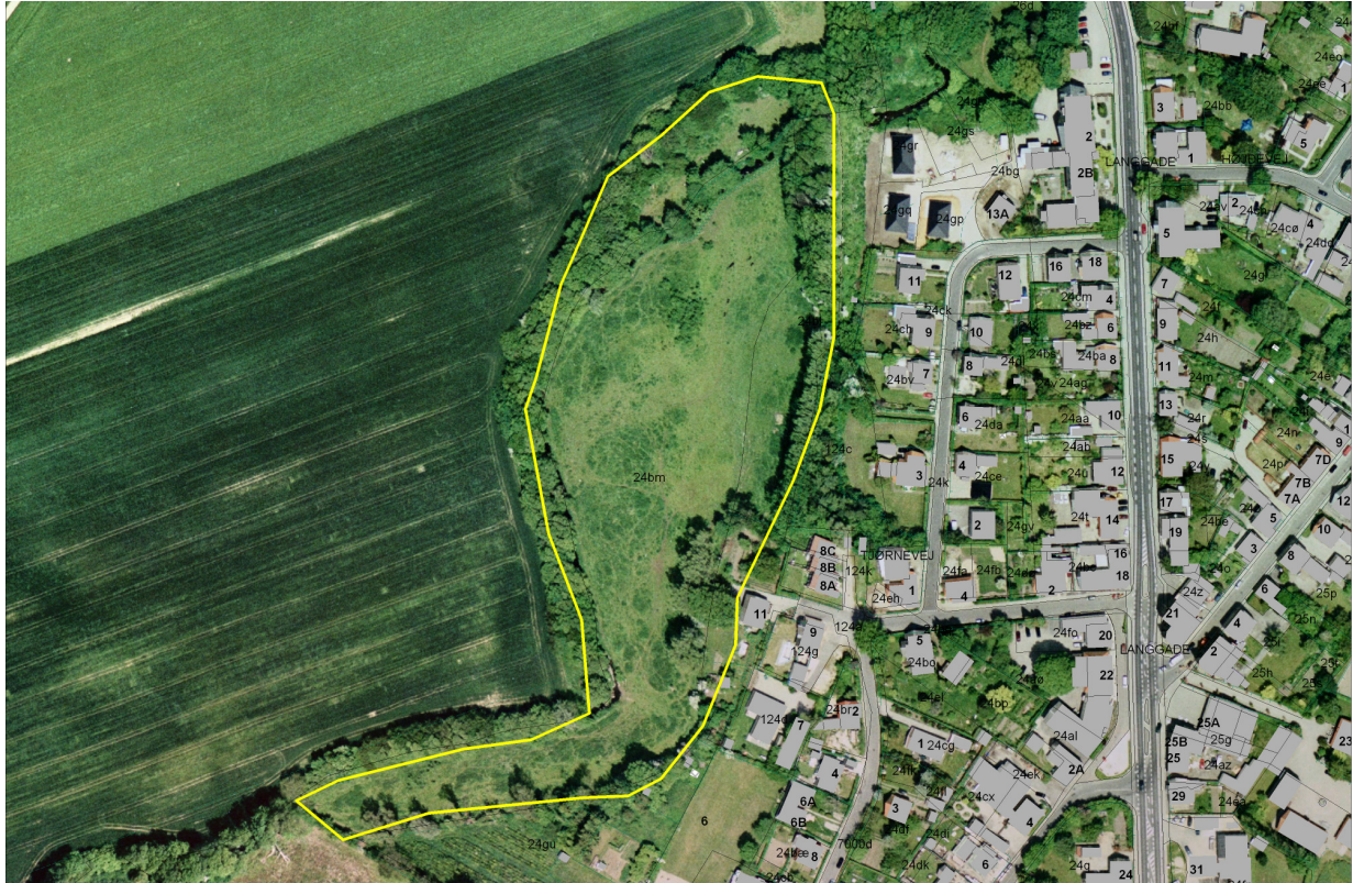
Luftfoto copyright COWI

Blandet natur med middelhøj bevoksning, det vil sige evt. med enkelte træer (gennemsnitshøj- de ½-2 meter) (mk) er lysåbne naturtyper med nogen bevoksning, evt. blot randbevoksning (typisk omkring moser). Naturtype markeret med gul streg.