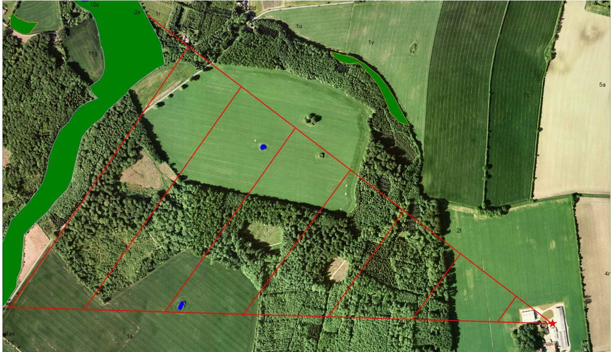
Luftfoto copyright COWI

Skov (s) omfatter tæt krat og skovlignende bevoksning eller tæt bebyggelse på mindst 50 % af strækningen fra stald/lager til naturområde. Resten af strækningen kan være dyrkede marker, græsarealer og/eller spredte bygninger. Opland er markeret med skravering.